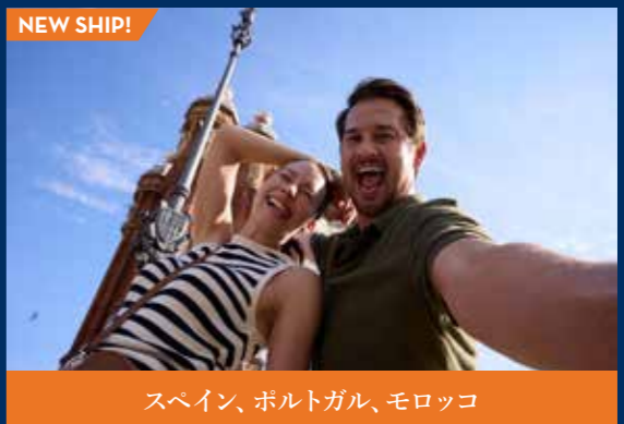
NEW SHIP! スペイン、ポルトガル、モロッコ

11泊12日 | セレブリティ・エクセル スペイン: バルセロナ → セビリア (カディス) → ポルトガル: リスボン → マデイラ (ファンシャル/1泊停泊) → モロッコ: タンジェ → スペイン: パルマ・デ・マヨルカ → バルセロナ