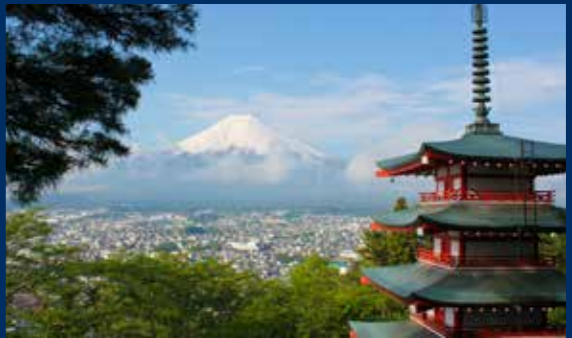
ベスト・オブ・ジャパン

7泊8日 | セレブリティ・エイベックス イギリス: サウサンプトン → ノルウェー: フロム → オーレンス → ベルゲン → ベルギー: ブルージュ (ゼーブルッヘ) → イギリス: サウサンプトン