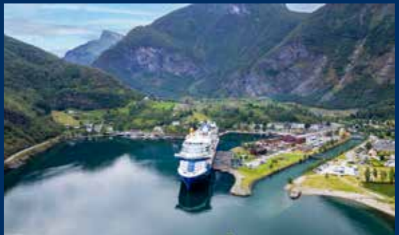
ノルウェー・フィヨルド

11泊12日 | セレブリティ・エクセル スペイン: バルセロナ → セビリア (カディス) → ポルトガル: リスボン → マデイラ (ファンシャル/1泊停泊) → モロッコ: タンジェ → スペイン: パルマ・デ・マヨルカ → バルセロナ