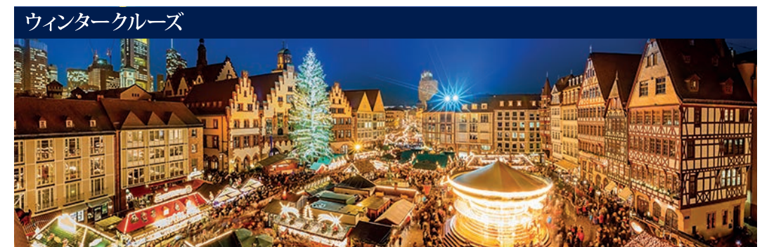
ブルゴーニュとプロバンスの至宝 リヨン→アルル→リヨン 7泊