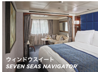
ウィンドウスイート SEVEN SEAS NAVIGATOR