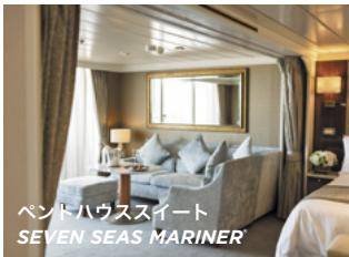
ペントハウススイート SEVEN SEAS MARINER