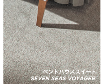
ペントハウススイート SEVEN SEAS VOYAGER