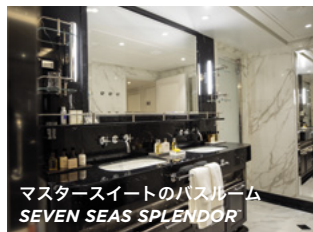
マスタースイートのバスルーム SEVEN SEAS SPLENDOR™