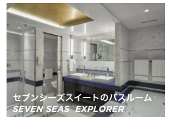
セブンシーズスイートのバスルーム SEVEN SEAS EXPLORER™