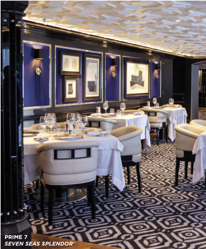
PRIME 7 SEVEN SEAS SPLENDOR*