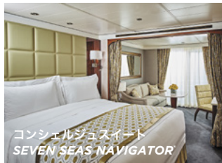
コンシェルジュスイート SEVEN SEAS NAVIGATOR