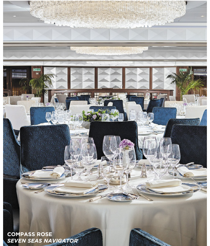
COMPASS ROSE SEVEN SEAS NAVIGATOR