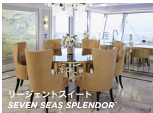
リージェントスイート SEVEN SEAS SPLENDOR™