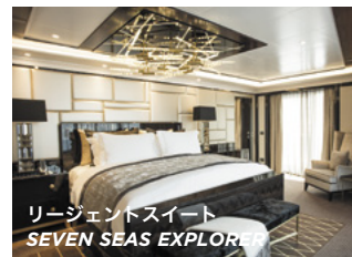
リージェントスイート SEVEN SEAS EXPLORER™