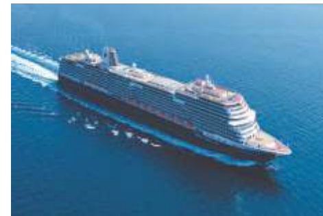
ピナクルクラス ニュースタテンダム 乗客定員 2,666 就航年 2018