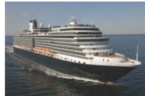
ピナクルクラス ユーロダム 乗客定員 2,104 改修年 2018 就航年 2008