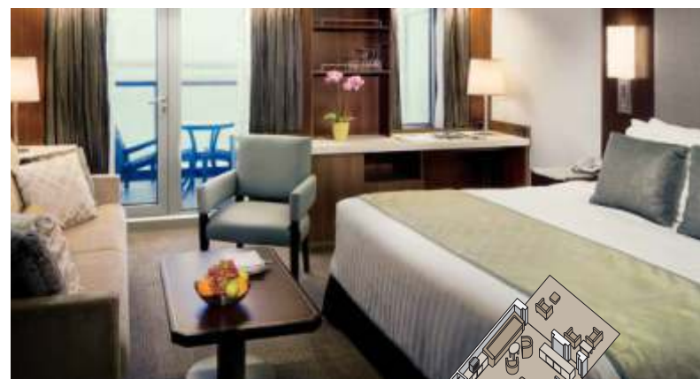
シグネチャースイート 約25.3~42.3㎡ バランダ付き