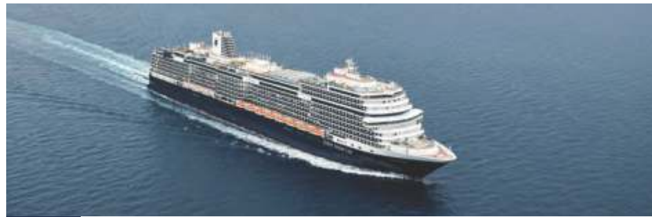
ピナクルクラス ロッテルダム 乗客定員 2,668 就航年 2021