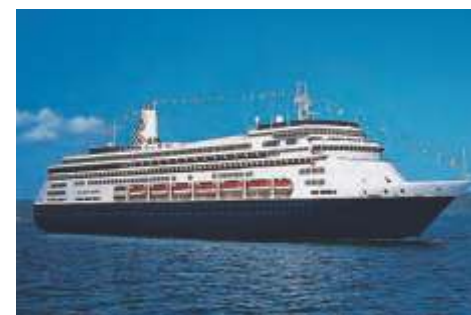
Rクラス フォーレダム 乗客定員 1,432 改修年 2019 就航年 1999