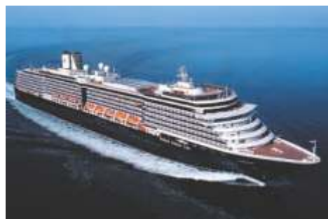
ピスタクラス ノールダム 乗客定員 1,972 改修年 2019 就航年 2006