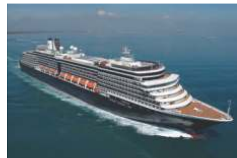
ピスタクラス ウエステルダム 乗客定員 1,964 改修年 2017 就航年 2004