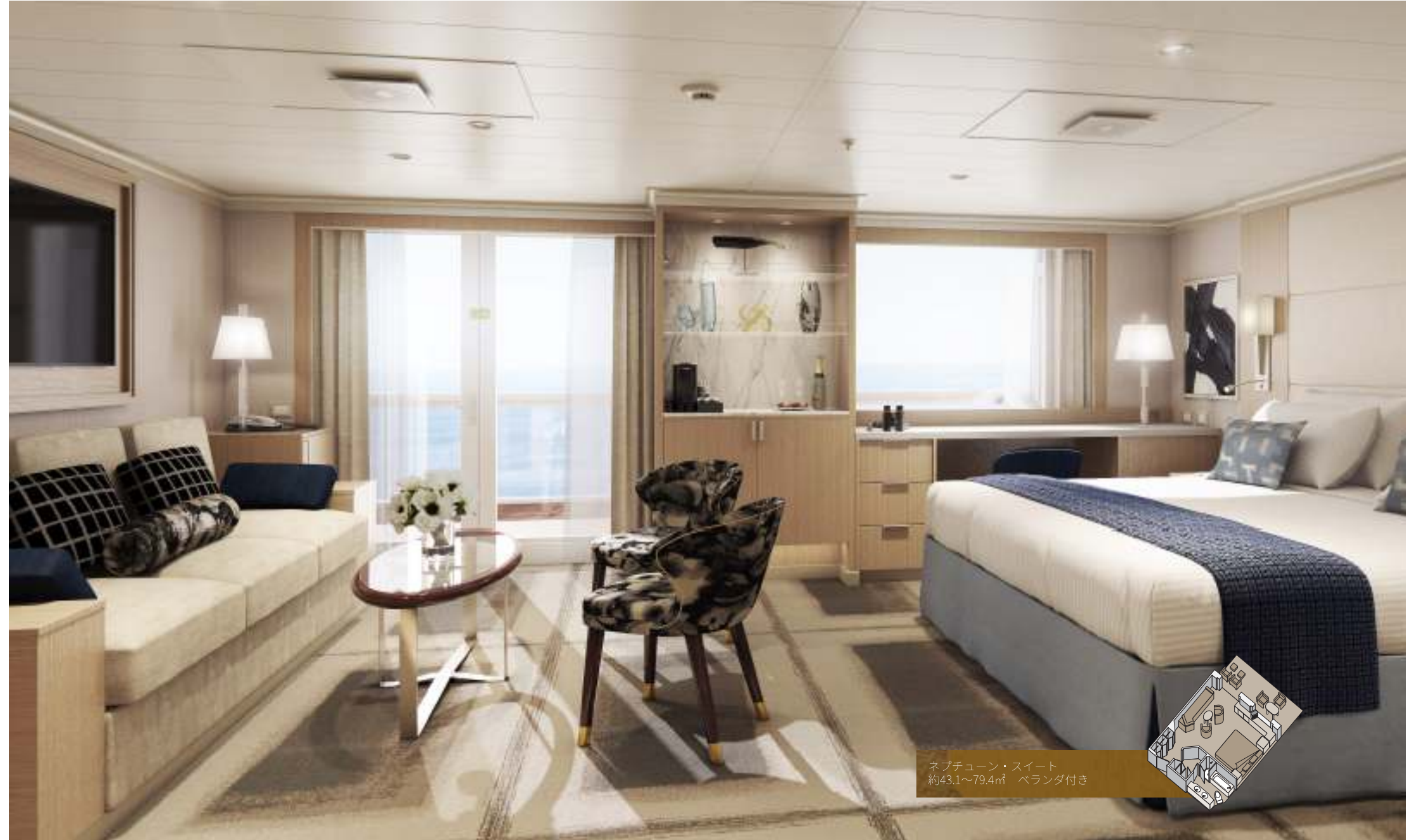
ネプチューン・スイート 約43.1~79.4㎡ バランダ付き

ロツテルダム、コーニングダム、ニュー・スタテンダムでは、一人旅のお客様にも快適にお過ごしいただけるよう、お一人様用のエレガントな客室をご用意しています。