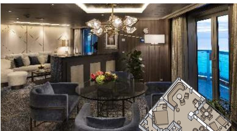
ピナクルスイート 約109~126㎡ バランダ付き