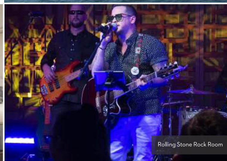
Rolling Stone Rock Room