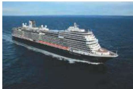
ピナクルクラス コーニングスダム 乗客定員 2,650 改修年 2018 就航年 2016