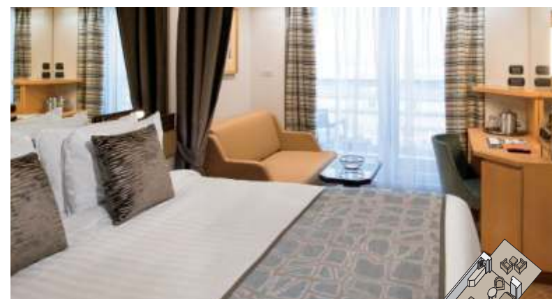
バランダ・ステートルーム 約19.6~39㎡ バランダ付き