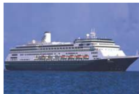
Rクラス ザンダム 乗客定員 1,432 改修年 2018 就航年 2000