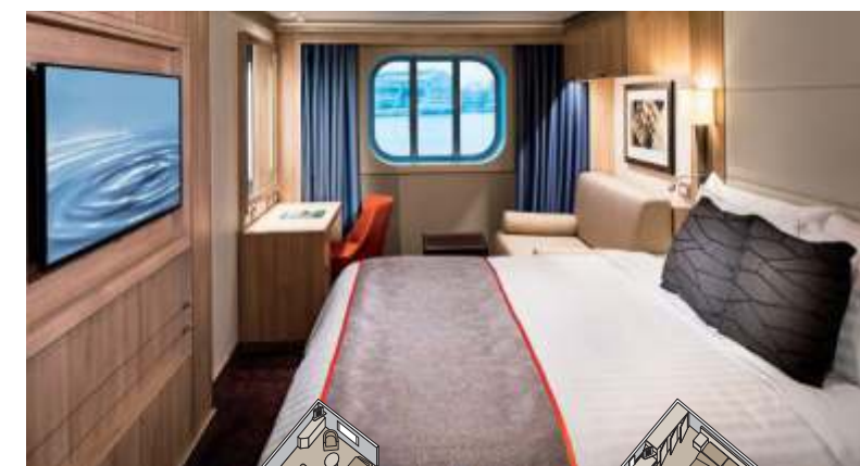
海側客室 ラージ 約16.3~26.1㎡