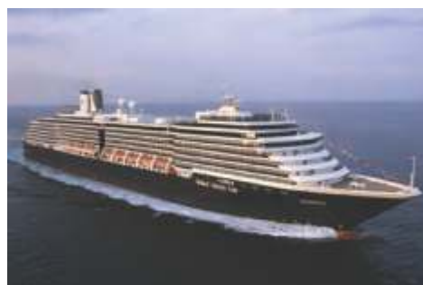
ピスタクラス ザイデルダム 乗客定員 1,964 改修年 2017 就航年 2002