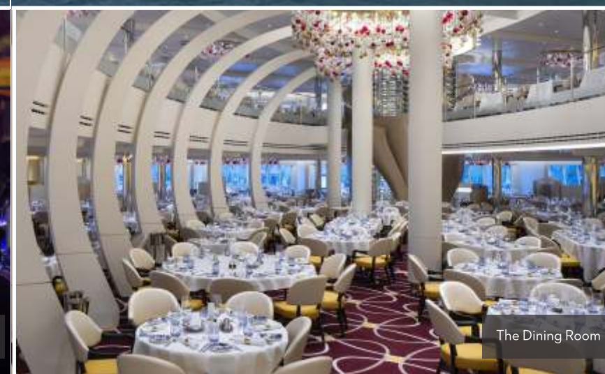
The Dining Room