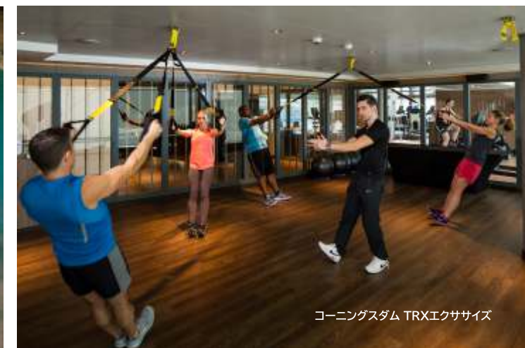
コーニングスタム TRXエクササイズ