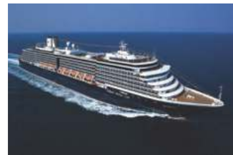
ピスタクラス オーステルダム 乗客定員 1,964 改修年 2019 就航年 2003