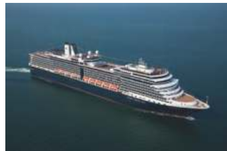
ピナクルクラス ニューアムステルダム 乗客定員 2,106 改修年 2017 就航年 2010