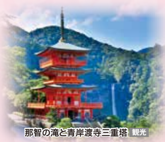
富士山と飛鳥II（イメージ）

■観光 熊野那智大社半日観光、熊野古道・大門坂と熊野速玉大社 ほか ■シャトルバスサービス(予定) JR 紀伊勝浦駅周辺