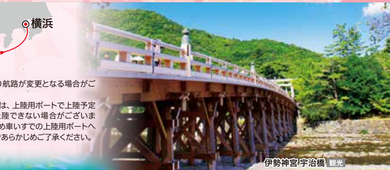
伊勢神宮宇治橋 観光