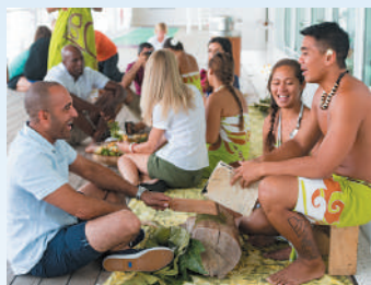
レ・ゴギャンズと一緒に船上でタヒチ文化を体験