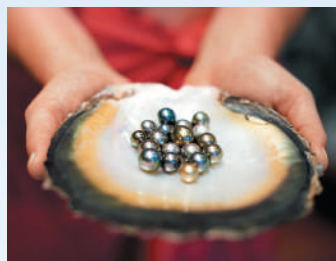
バニラ農園と黒真珠養殖場を訪問 (オプションツアー)