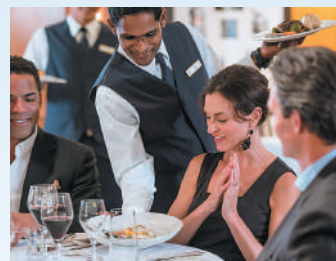
ディナーはパリの有名シェフ監修の本格フレンチを

クルーズ出航日の前日から起算して91日前まではキャンセルチャージはかかりませんので、早めのお申し込みをお勧めいたします。