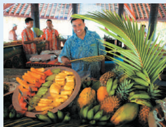
プライベートアイランドでトロピカル・フルーツやランチBBQを満喫