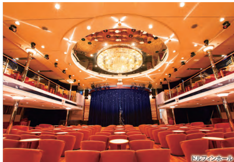
ドルフィンホール

ブロードウェイ・ミュージカルや東宝や明治座の演出を手掛けている玉野和紀が、にっぽん丸でしか観賞できないミュージカルをお届けします。