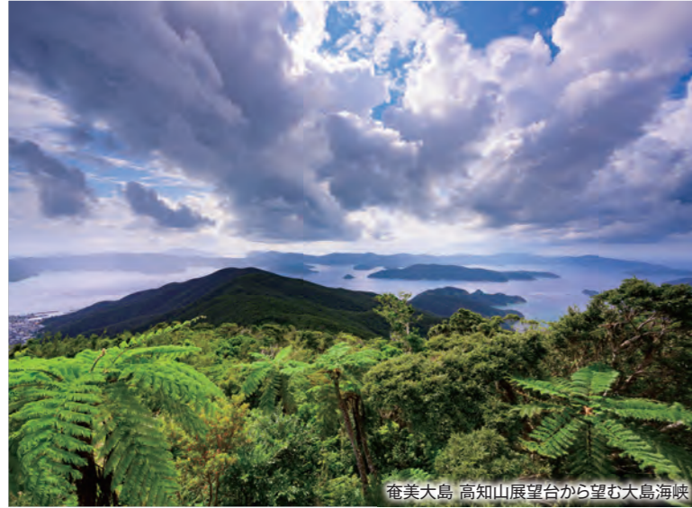
奄美大島 高知山展望台から望む大島海峡