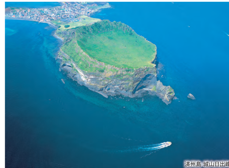
済州島 城山日出峰

済州島では、にっぽん丸がおススメする韓国名物サムギョプサルをご希望の方に昼食としてご用意いたします。