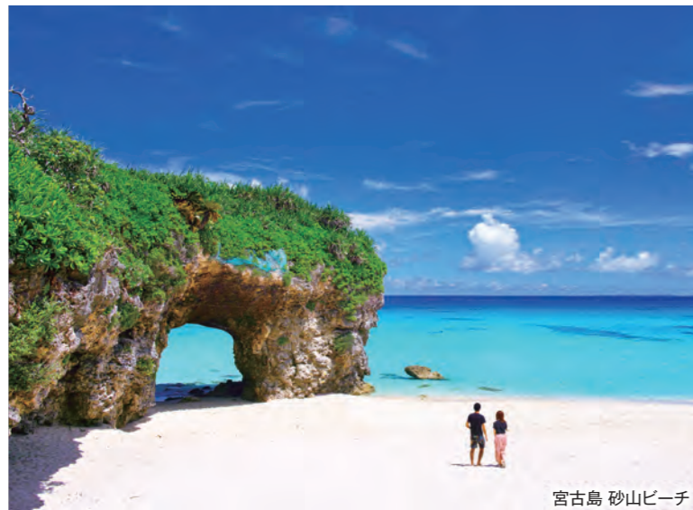
宮古島 砂山ビーチ