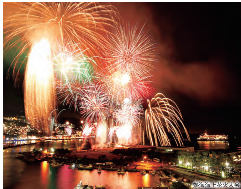
熱海海上花火大会