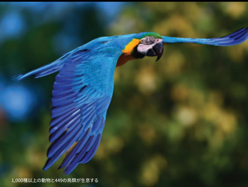
1,000種以上の動物と449の鳥類が生息する