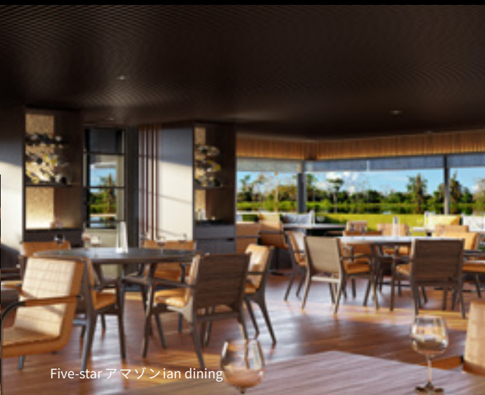
Five-star Amazonian dining