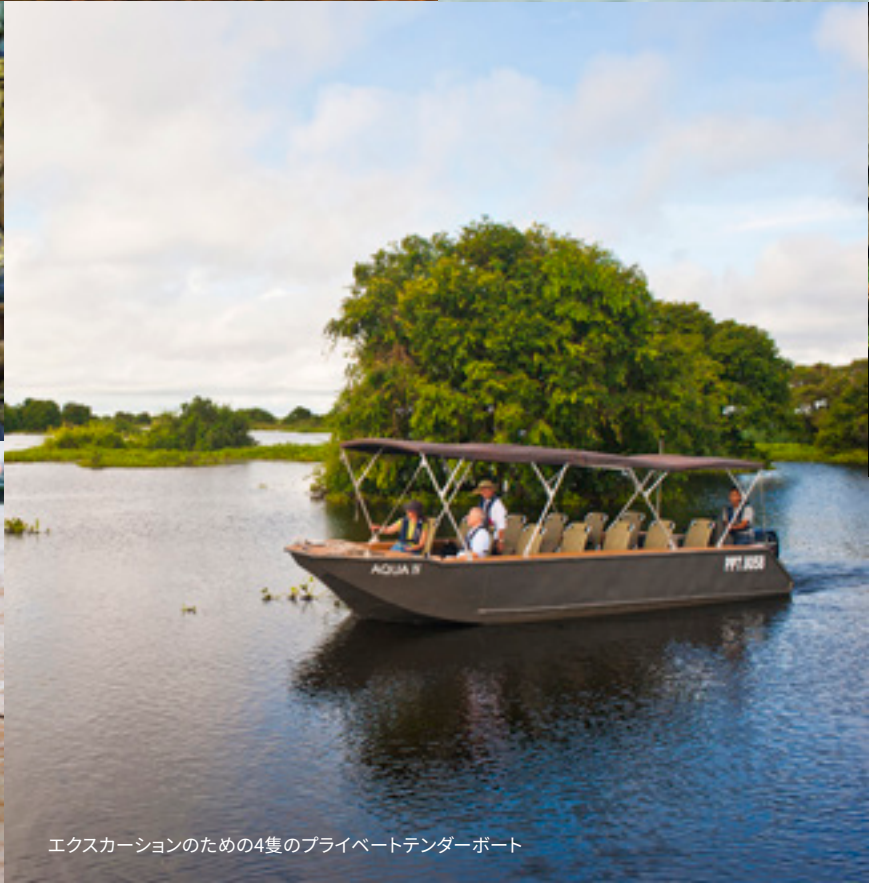
エキスカージョンのための4隻のプライベートボート