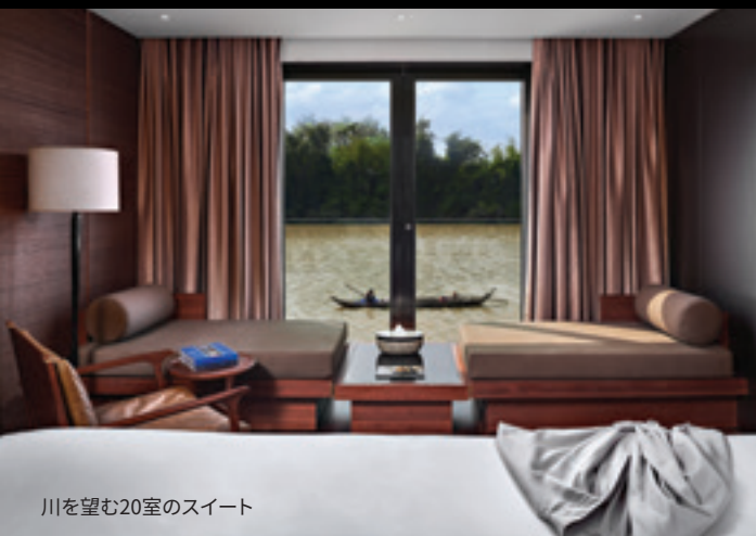
川を望む20室のスイート