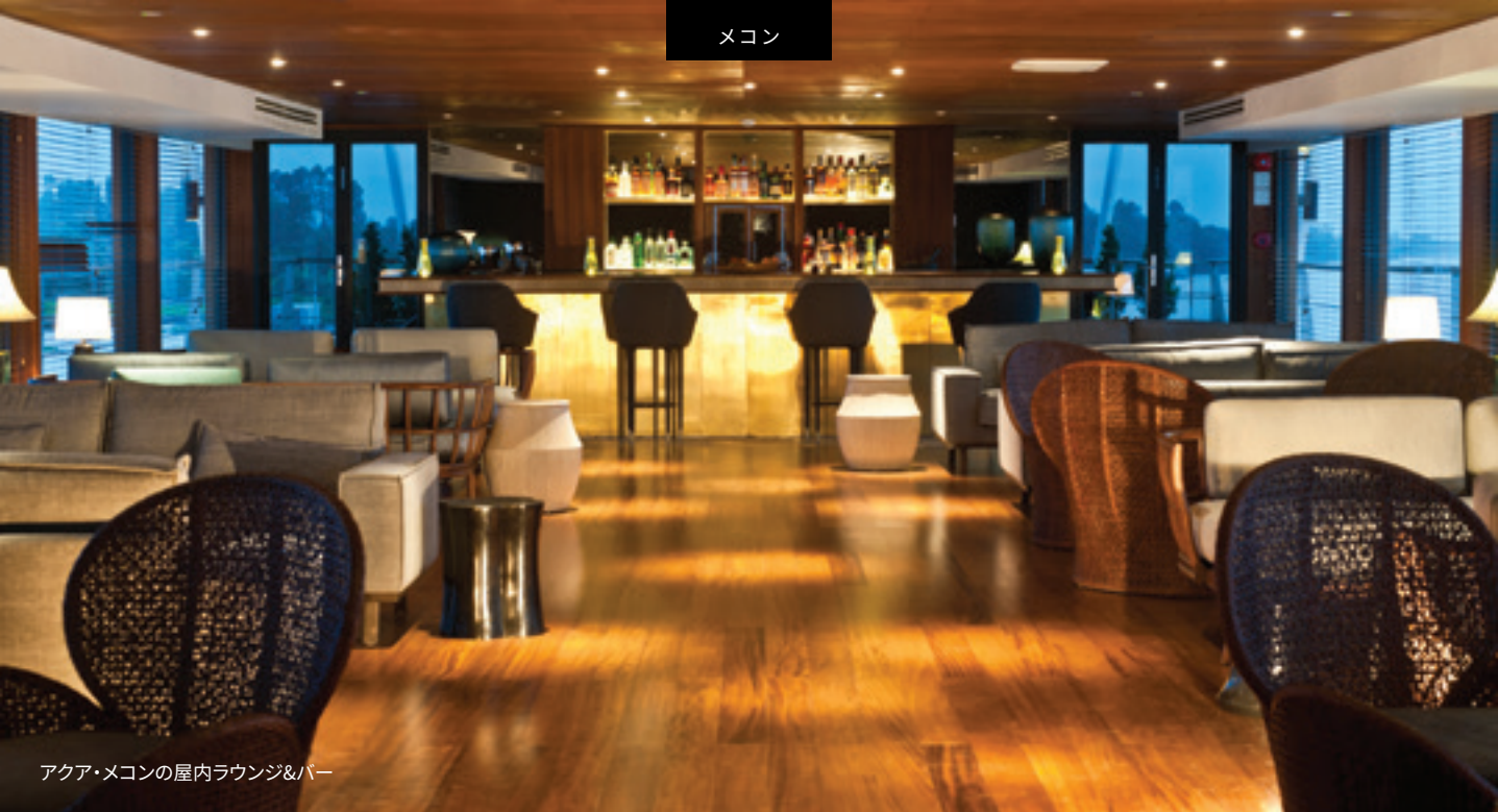
アクア・メコンの屋内ラウンジ&バー