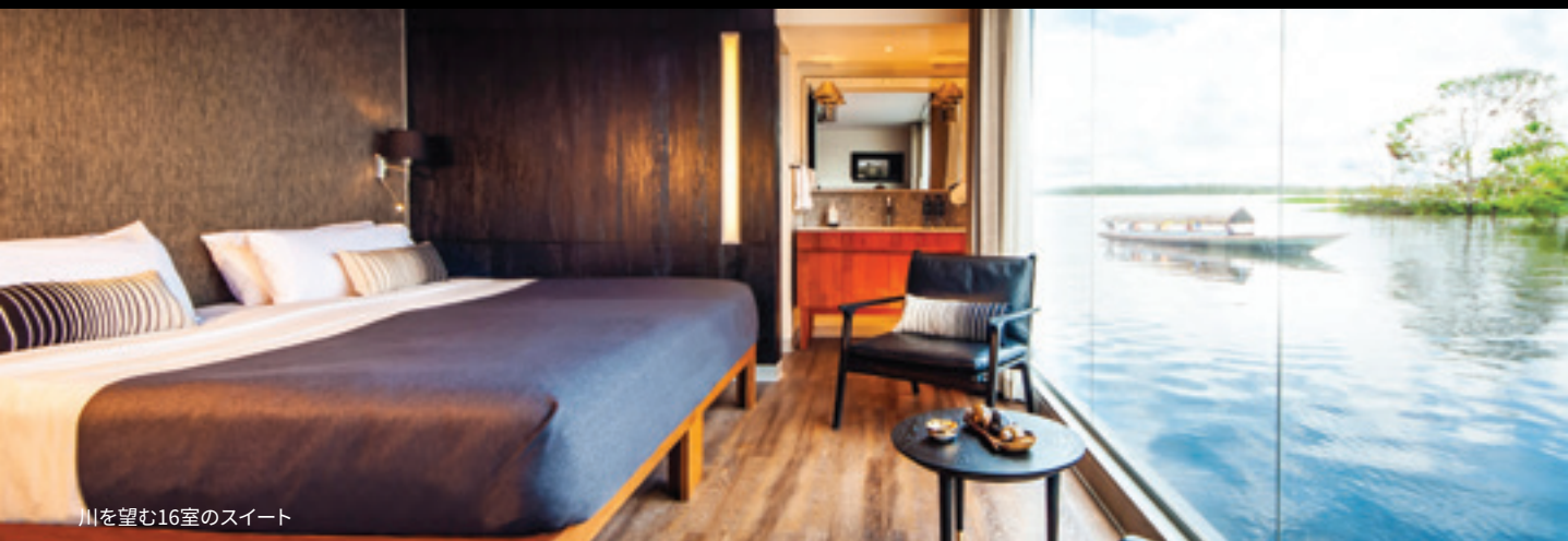
川を望む16室のスイート