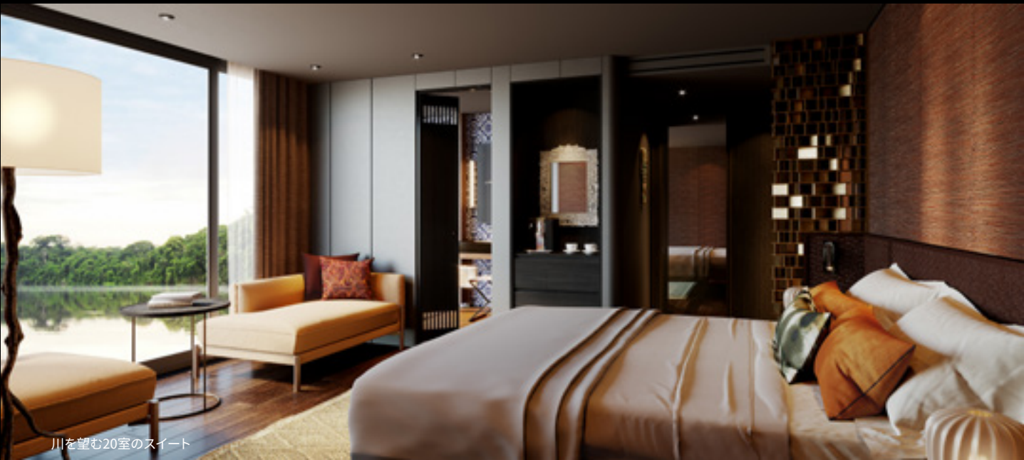
川を望む20室のスイート