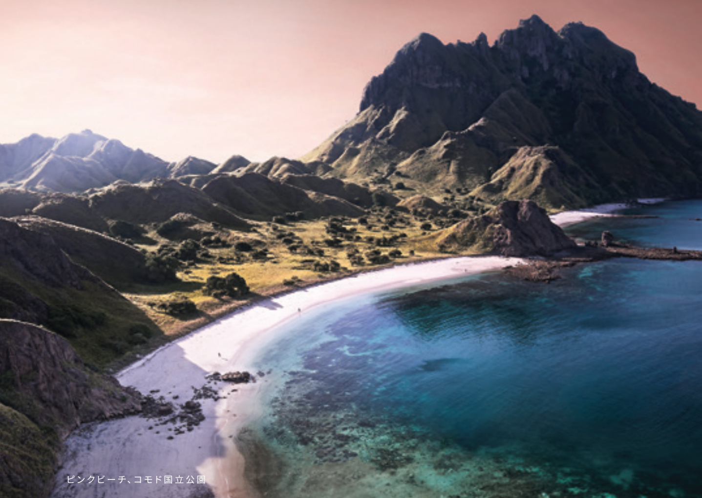
ピンクビーチ、コモド国立公園