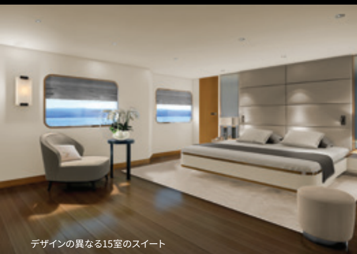
デザインの異なる15室のスイート