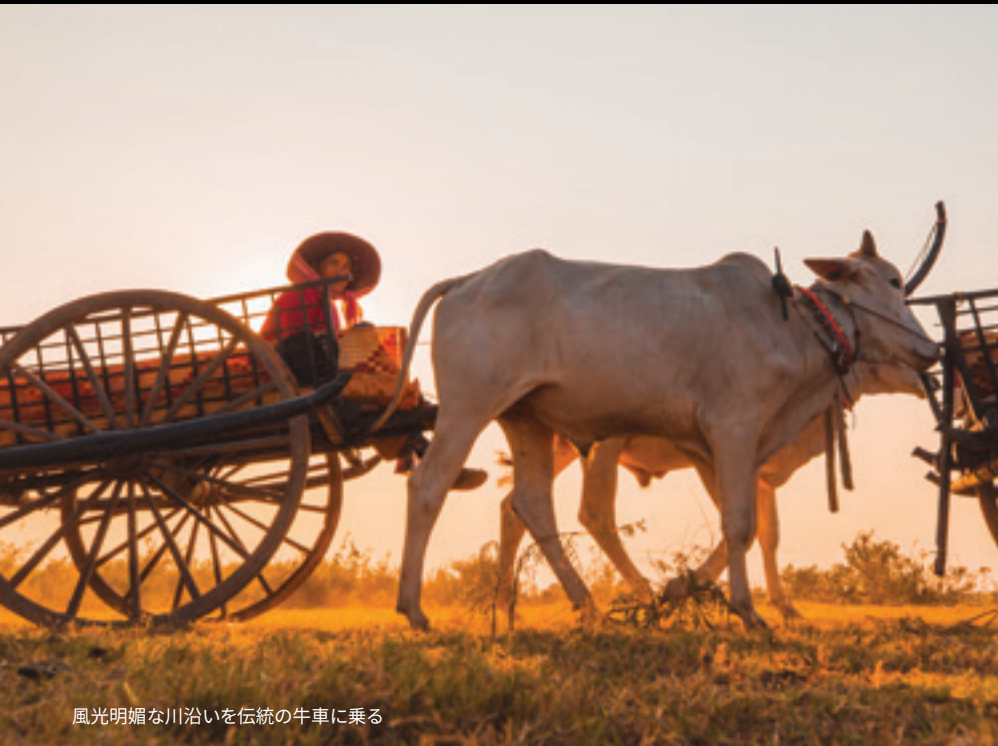
風光明媚な川沿いを伝統の牛車に乗る