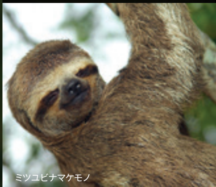
ミツユビナマケモノ