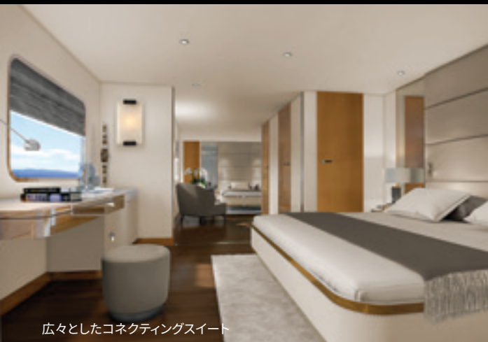
広々としたコネクティングスイート