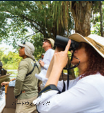
バードウォッチング