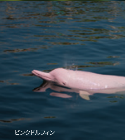
ピンクドルフィン