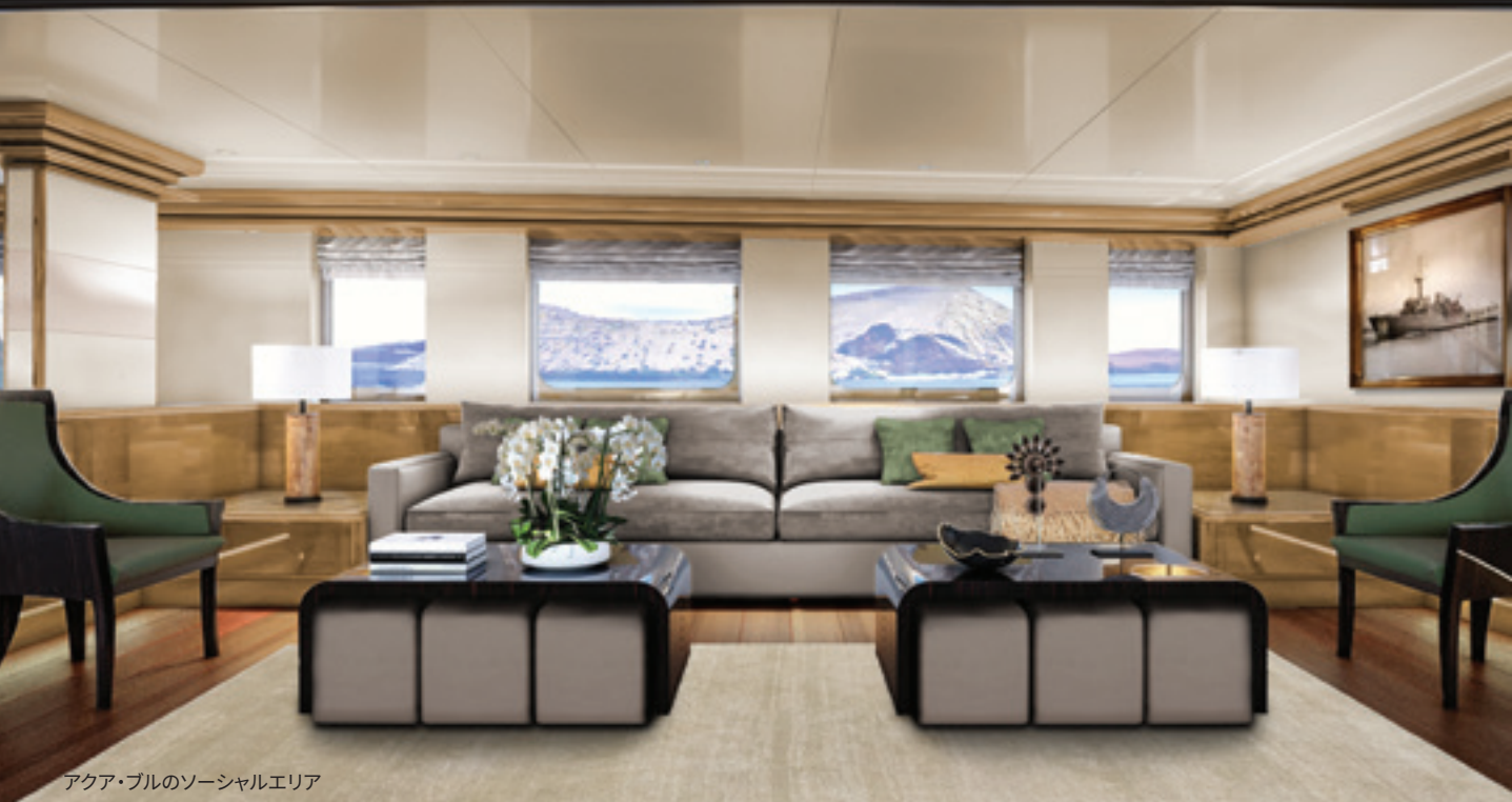
アクア・ブルのソーシャルエリア