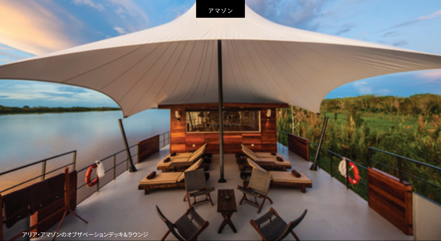
アリア・アマゾンのオブザベーションデッキ&amp;ラウンジ