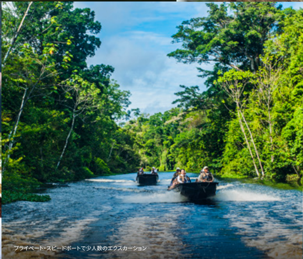
プライベート・スピードボートで少人数のエクスカージョン