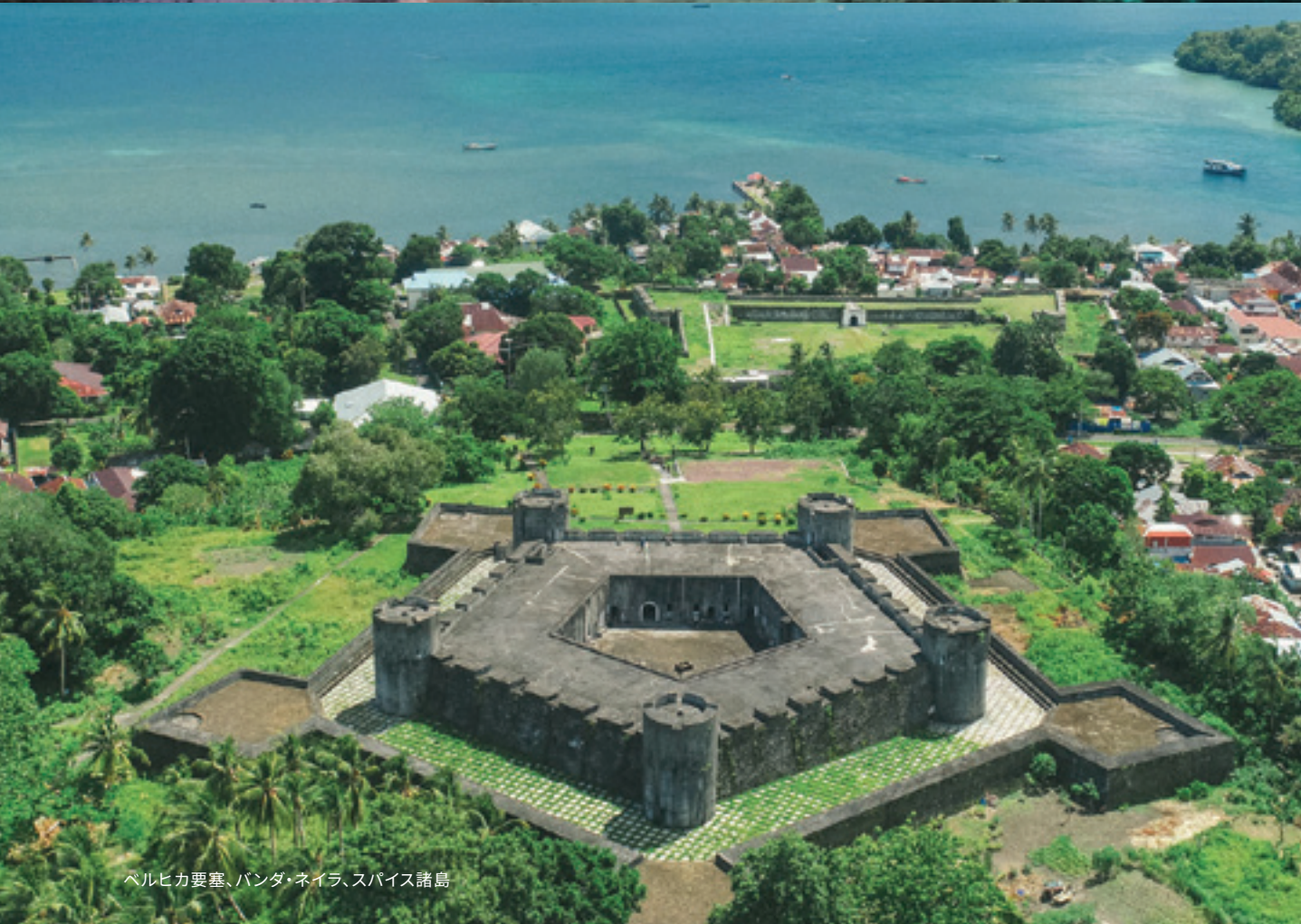
ヘルヒカ要塞、バンダ・ネイラ、スパイス諸島